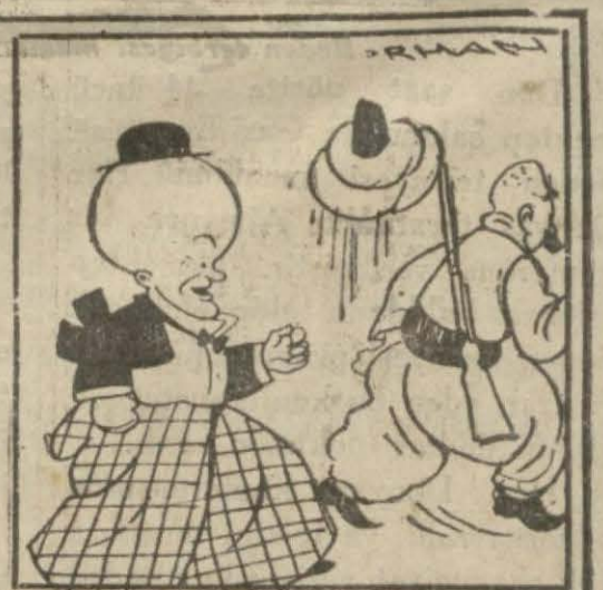
Hasan Bey — Öyle ise sağdan geri marş... Biz artık memleketimizde karga besleyemeyiz: Geri..