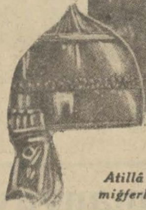
Atillâ devri miğferlerden