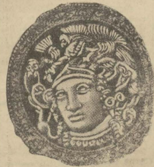
Mezarda bulunan bir para

Bu vak'a büyük Türk camiası için derin bir matem vesilesi oldu. Atillâ'nın kumandanları, onu Moldavya nehrine gömdüler. Gömmeden evvel de nehrin mecrasını değiştirdiler. Cesedi bir demir sandukaya koydular. Bu sandukanın içine de ayrıca ve iç içe biri gümüş, diğeri altın iki tabut yerleştirilmişti. Ceset bu altın tabutun içindeydi. Sonra tekrar nehir eski mecrasına iade edildi. Atillânın ölümü ve mezarına