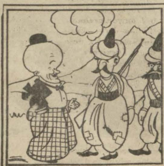
Hasan Bey — Kimlerdensiniz bakayım?