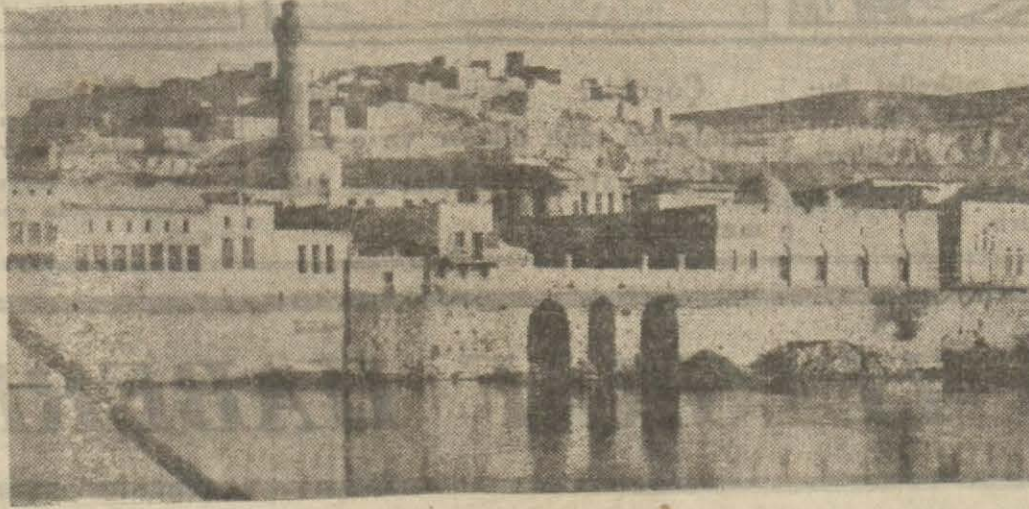
Birecikten bir manzara

Yeşil dağ etekleri denilen tepeye yaslanmış, etrafı kale ile çevrilmiş ve dört kapı dahilinde kurulmuş olan kasabamızın binaları çok sık ve birbirine girmiş bir şekilde kesme taşlardan yapılmıştır. Kasabanın şimalinde Arap devrinde kalma on iki bürç üzerine yapılmış yedi katlı (Küvi gevher)