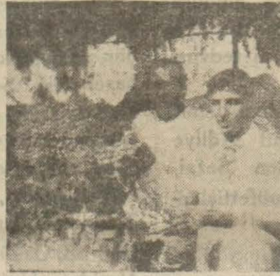
İstanbul'a ilk üzüm mahsulü gönderilirken

Tavşancıl: Gebze'de (Hususi) — İzmit körfezi dahilinde çavuş üzümle şöhret bulan köyümüz ilk mahsulünü İstanbul'a göndermiştir. Bu sene körfez dahilinde çavuş üzümünün az olduğu söylenmektedir. Maamafih köyümüzün mahsulü iyidir ve İstanbul'lulara bol bol çavuş üzümü verilecektir.