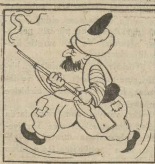
Hasan Bey — Yahu, a'x hâlâ yaşıyor musunuz? Evet evet hatırladım, siz umumi harpte memleketimizde yaşadığımız halde bize de silâh çekmişiniz!