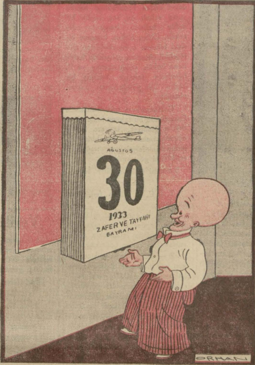
Hasan Bey — Yarın büyük zaferin yıldönümünü yaşıyacağız, ne mutlu bize!..