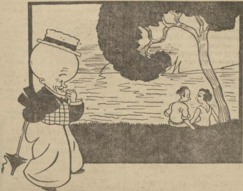
Hasan Bey — Acaba bunların burunları da Moda burnuna geldikleri için mi büyüdü?